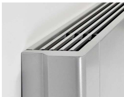
Kun 12,9 cm dybde

220/1/50Hz. Kjølekapasiteten er basert på romtemperatur 25 °C fuktighet 50 % og isvann 7/12°C. Varme ved maks hastighet, romtemperatur 20°C og vanntemperatur 70/60 °C. Lydmålingene er utført etter ISO7779